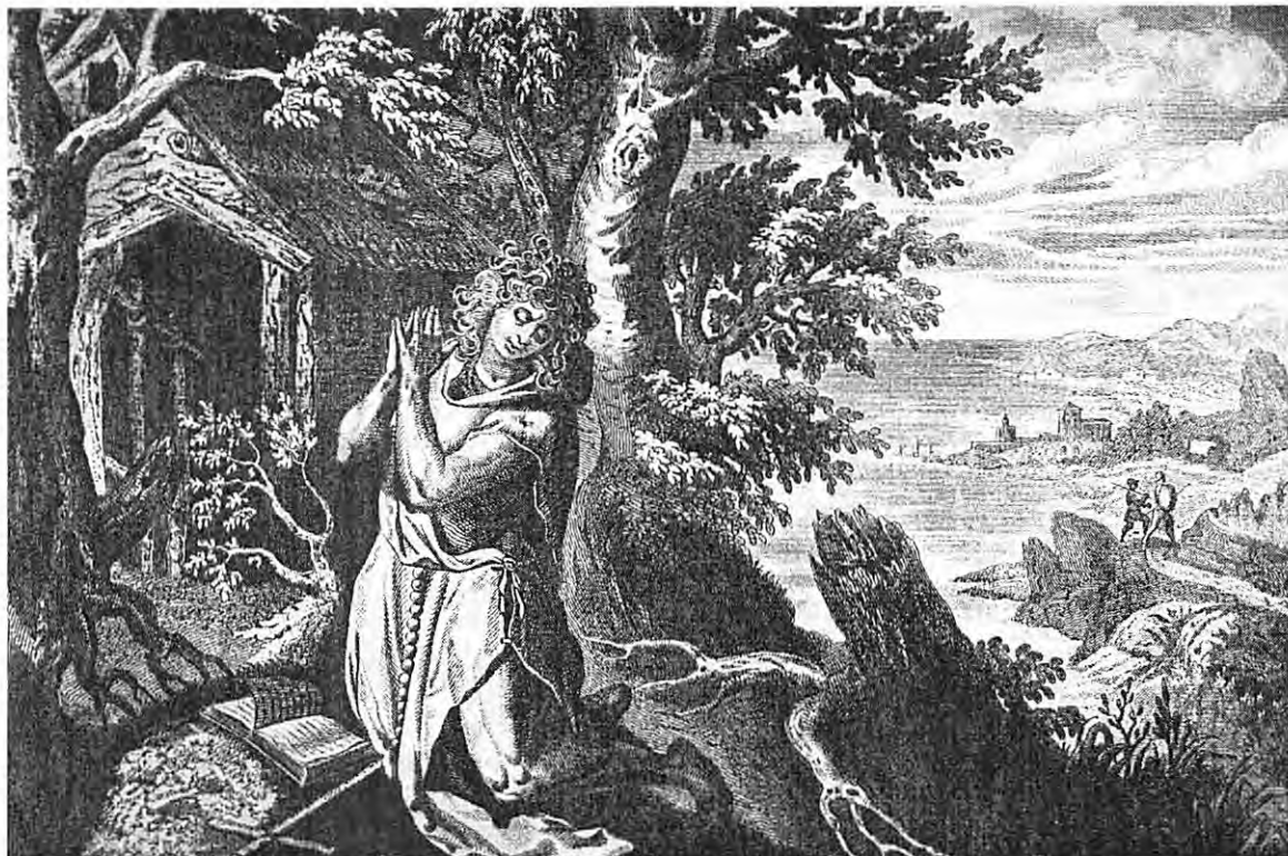
Un saint ermite priant et se mortifiant devant un paysage champêtre – Gravure de Céroni dans MARIN & VEUILLOT (1864).