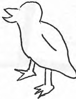
Auf dem Siegel WALTERs I. von Klerf 1342