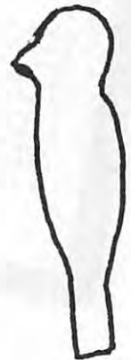
Auf dem Siegel WALTERs II. von Klerf – 1371