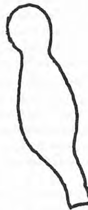
Auf dem Siegel Georgs von Brandenburg-Klerf 1511