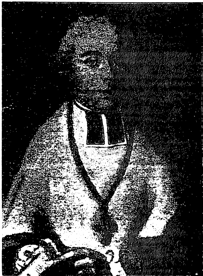
Jean-Baptiste de Terme, originaire de Sonlez. Devenu prélat à la cour impériale de Vienne en 1778, il fut l'ami intime de Joseph II qu'il influença dans ses idées religieuses et sans doute dans la politique que l'empereur mena dans la Belgique sous domination autrichienne. Cette politique jugée autoritaire fut cependant inspirée par la tolérance et la foi religieuse de cet ecclésiastique wallon très à l'aise au sein d'une cour qui, à l'époque, parlait français.

Das Omega-Programm hat sich offenbar bewährt. Unter anderem hat man im Schatten des Trierer Doms, im Bistumsarchiv und im Kreisarchiv Saarlouis die zeitgemäße EDV erworben, um die Familienforschung zu unterstützen.