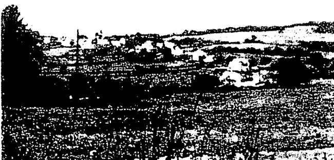
Les villages de Doncols (en haut) et de Sonlez (en bas) : une petite « Wallonie » en plein Grand-Duché, à quelques kilomètres de Bastogne , dans la plus sauvage Haute-Ardenne. Vous y rencontrerez peut-être encore quelques vieux « causant noss' wallon ».