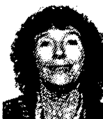
QUESTION A MONIQUE BYDLOWSKI PSYCHIATRE, PSYCHANALYSTE, CHERCHEUR A L'INSERM