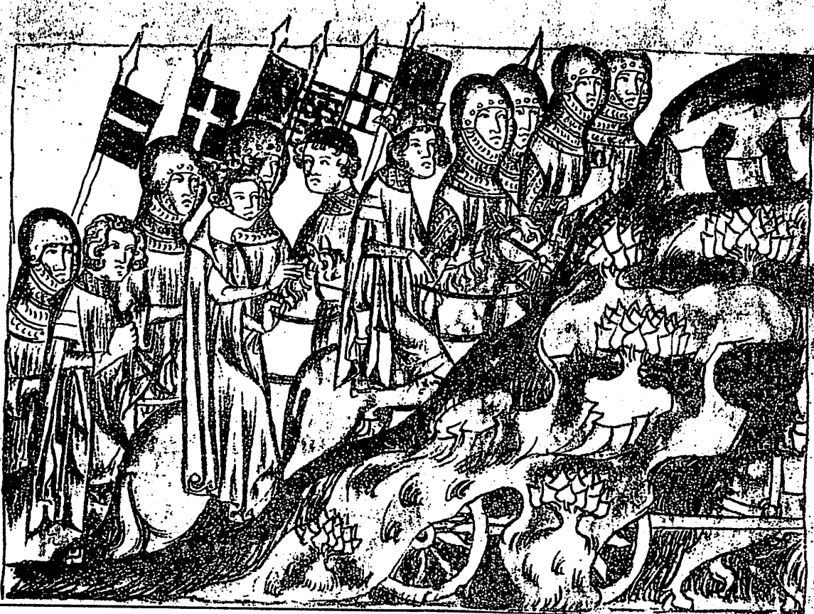
L'empereur Henri VII passe le Mont Cenis (folio 7 recto du manuscrit de Coblenz)

edimond – Ministero per i Beni culturali e ambientali, Ufficio Centrale per i Beni archivistici ROMA – 1994