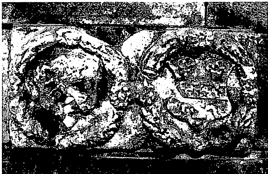
Pierre armoriée (armes d'alliance d'ALSCEID-de SCHELLART), provenant du château de Gerlache (Photo Joseph COLLETTE).