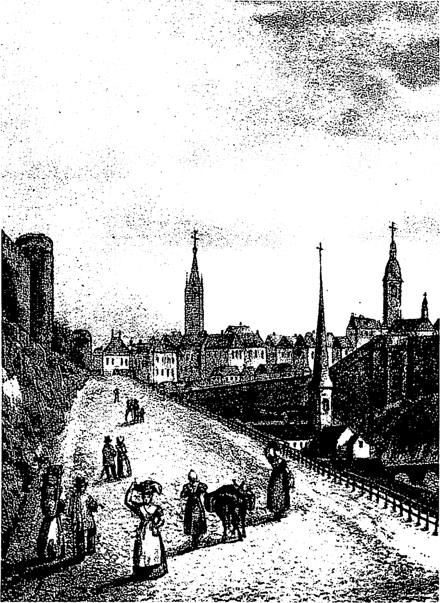
Vue de la Ville de Luxembourg à partir de la route de Trèves qui mène à la Tour Jacob ; de gauche à droite les clochers des églises Notre-Dame, St-Jean-du-Grund et St-Michel. (Extrait d'une lithographie anonyme de 1827).