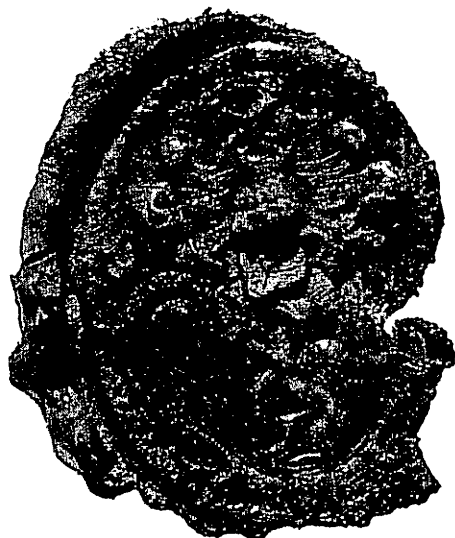
Cachet aux armes d'ALSCHEID (1692). Cire rouge. 19 x 15 mm.