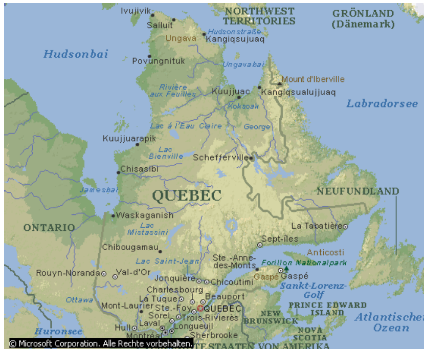
Voici une carte sur Québec!

Voici une liste de mots fréquemment utilisés: