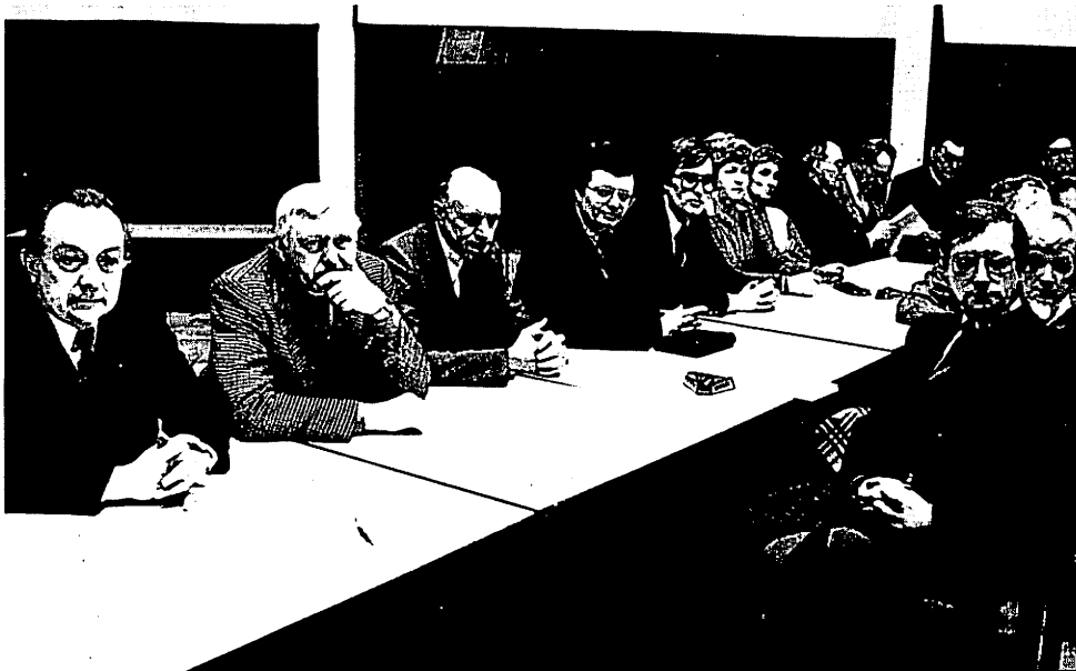
Des auditeurs attentifs