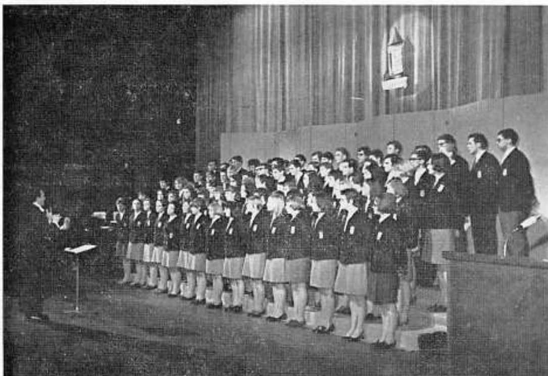
Erstes Galakonzert 1968 im hauptstädtischen Theater