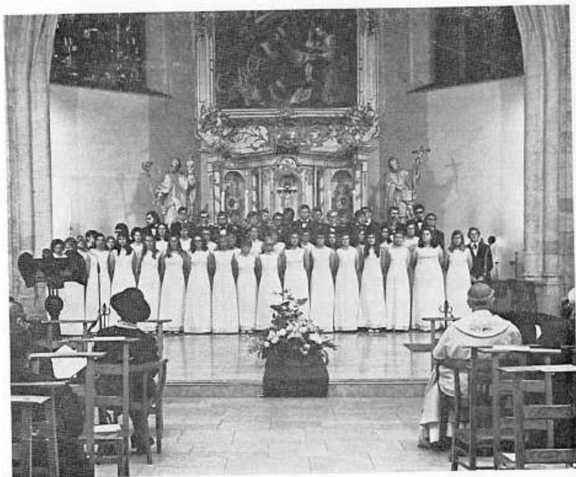
Orgelweihe in St. Michel (10. 10. 71)