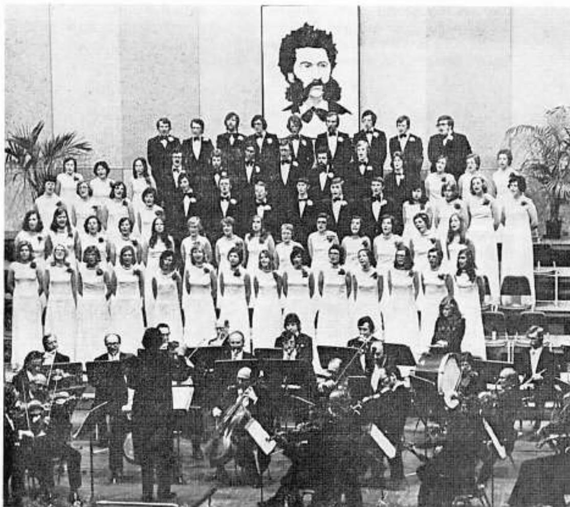
Johann-Strauss-Konzert in Luxemburg

"Jong-Letzeburg" empfängt in Luxemburg den amerikanischen Studentenorchester des "Blue Lake Fine Arts Camp" aus Twin Lake, Michigan, mit dessen Mitgliedern durch die Unterbringung in Familien eine sehr gute Freundschaft entsteht, und die durch ihre jugendliche Frische und mit amerikanischem Programm (zur 200-Jahr-Feier der USA) bei Konzerten in Luxemburg (Cercle Municipal) und in Wormeldingen begeistern.