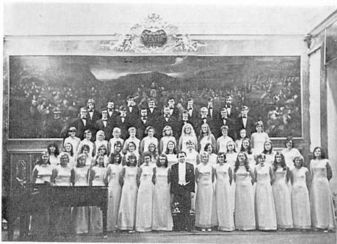
Konzert im Minoritenaal in Graz (6. 9. 72)

Ein ausverkauftes Galakonzert im Neuen Theater (19. 2. 72) sowie 19 weitere Auftritte (in Luxemburg, Hesperingen, Wasserbillig, Mondorf, Capellen usw.) machen dieses Jahr zum bisher aktivsten der erst siebenjährigen Vereinsgeschichte.