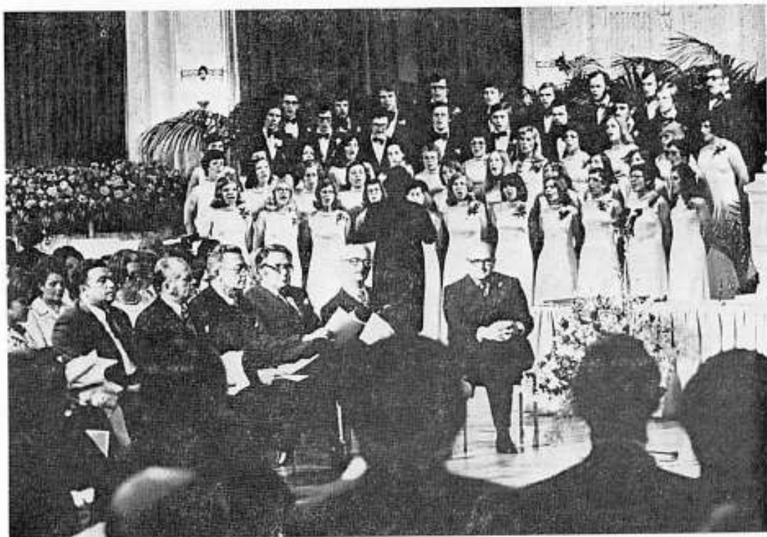
Offizieller Empfang für den österreichischen Bundespräsidenten Dr. R. Kirchschräger