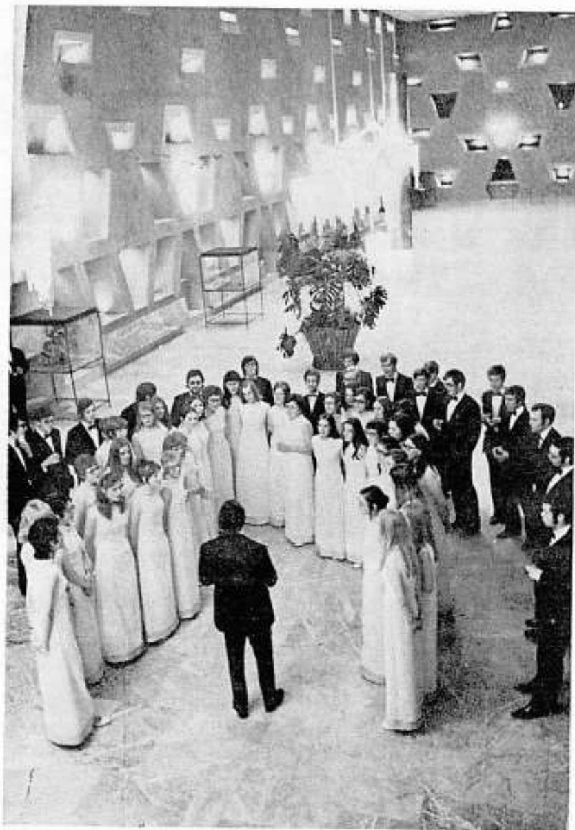
Ständchen bei einem der vielen Empfänge

Wenn bei dieser professionell anmutenden Aktivität auch die Hauptlast bei Dirigent, Vorstand und Aktiven liegt, so soll hier auch all derer gedacht und all denen herzlichst gedankt werden, die an Aufstieg und Erfolgen eines gemeinsamen Anliegens, dem Chor "Jong-