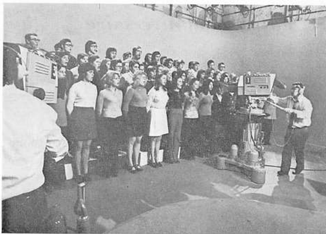
Probe im RTL - Fernsehstudio

Die Konzertreise zum luxemburgischen Nationalfeiertag 1969 nach Paris (mit 3 Bussen und 105 Aktiven) bringt "Jong-Letzburg" den ersten Fernsehauftritt in der Sendung "Télé-Dimanche" mit Dalida und Antoine, der sich mit "Bonjour, Salut !" ins Ehrenbuch einträgt.